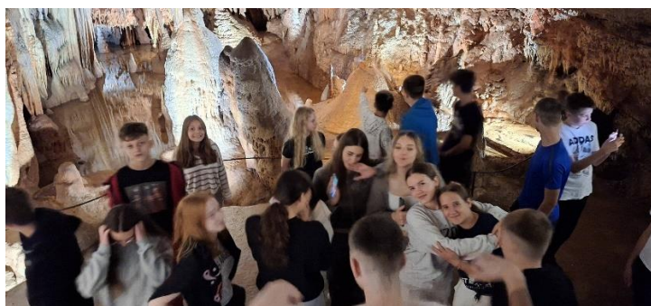
Osmaši u jami Baredine i u Puli