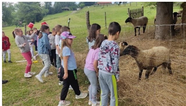
Prvašići u etno selu Stara Marča