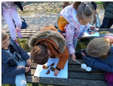
Drugaši uče o jeseni