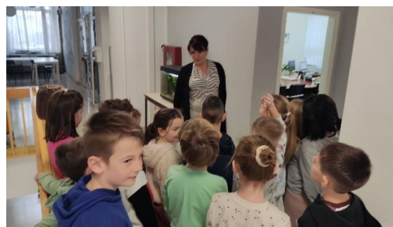
Školski medni dan