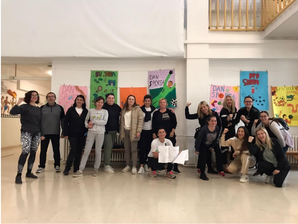
Učitelji u orijentacijskom kretanju na Danu sporta 24. travnja 2024.