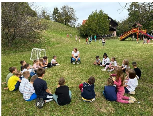
Prvašići u prirodi Eko kuće Bubamara