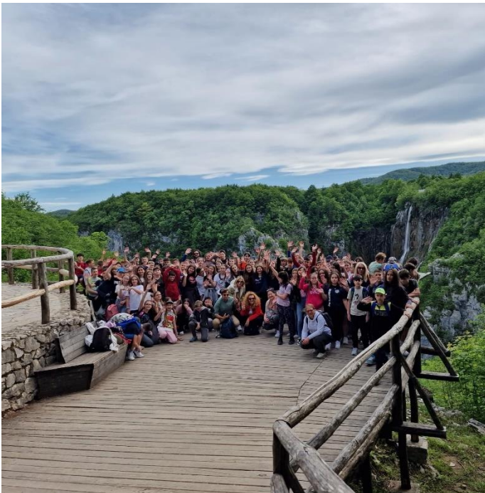
Šestaši na Plitvičkim jezerima

Odrađene su i planirane izvanučionične i terenske nastave: trećaši su otišli stopama družine iz Lovrakova Vlaka u snijegu u Veliki Grđevac, četvrtaši su posjetili Rijeku, riječki Astronomski centar i planetarij, Fužine i spilju Vrelo, prvašići su bili u etno selu Stara Marča, drugaši su posjetili zračnu luku, Glavni kolodvor i autobusni kolodvor u Zagrebu, a šestaši su uživali u NP Plitvička jezera.