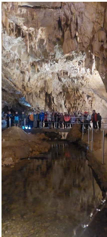
Četvrtaši u spilji Vrelo