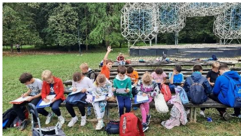
Trećaši u potrazi za blagom