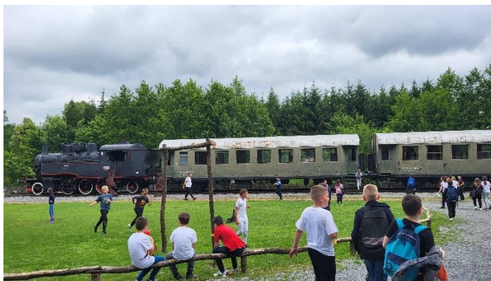
Trećaši u Velikom Grđevcu