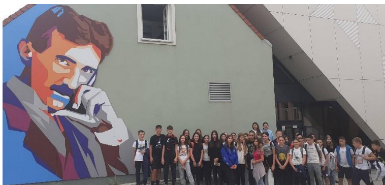
Sedmaši na terenskoj nastavi

Listopad su obilježili odlasci na terenske nastave pa su tako sedmaši otišli u Liku gdje su posjetili Baraćeve spilje, novootvoreni Speleon i muzej Nikole Tesle – Nikola Tesla Experience Center, trećaši su pak otišli u potragu za blagom u Maksimir, a drugaši su u Maksimiru učili o jeseni. Osmaši su posjetili jamu Baredine i Pulu, a prvašići Eko kuću Bubamara.