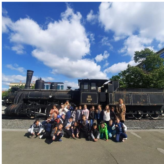
Drugaši na Glavnom kolodvoru