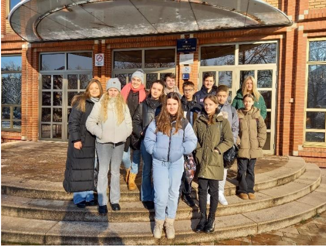
Matematičari na "Lucku"

Matematičari su se okušali u 13. Ekipnom natjecanju osnovnih škola "Lucko" u Gimnaziji Lucijana Vranjanina te osvojili 3. mjesto.